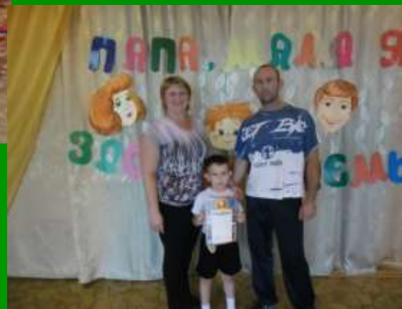
МДОУ д/с № 4 «Буратино» р.п. Кузоватово